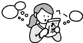
多くの情報から「おいしさ」を判断する大人

最近では、「〇〇さん家のお米」といったように、何処で誰が作ったかが、わかる形で販売されています。時には田んぼの風景、お米を作っている農家の人々の姿、お米のおいしさを思い浮かべながら、お米を選んでみましょう。「人間は脳で食べている」と言われる程、情報が「おいしさ」に大きな影響を与えています。周囲の大人がお米を意識することで、子どもは、自然にお米のおいしさに注目して、しっかりと味わうことができます。