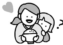
周りの大人の反応に影響を受ける子ども