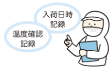
安全な食材の購入

低年齢児は、身体が小さく、抵抗力が弱いため、少量の菌で食中毒の症状を呈するリスクがあります。給食では「安全」のために、厳格なルールのもとで管理された食事を提供しています。食中毒の予防3原則は、「つけない」「ふやさない」「やっつける」。家庭でも衛生的な食事の提供を心がけましょう。