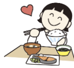
減塩・減糖・減脂でおいしく