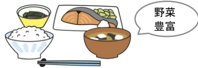
主食・主菜・副菜をそろえる

園では、子どもに必要な栄養を満たした食事を、食育の一部として計画的に提供しています。食経験の少ない子どもが無理なく、楽しく食べることができ、必要な栄養も摂取できるように、食材と調理法を選択しながら主食・主菜・副菜をそろえています。特に健康に欠かすことができないビタミン、ミネラル、食物繊維を多く含む「野菜」を積極的に取り入れています。また、将来の生活習慣病に配慮し、「減塩」「減糖」「減脂」を心がけ、健康的な食事で、しっかり栄養を摂取することを目指しています。