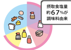
厚生労働省 令和元年 国民健康・栄養調査より作成

日本人が摂取している塩分のうち、調味料由来が67%となっています。減塩するには、「調理に使う調味料」、また「料理にかける食卓調味料」を減らすことが有効です。子どもが好きなマヨネーズ、ドレッシング、ケチャップ、ソースの使い過ぎには注意しましょう。